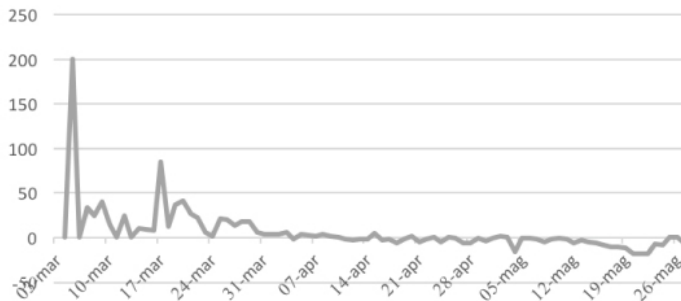
VARIAZIONE PERCENTUALE CONTAGI