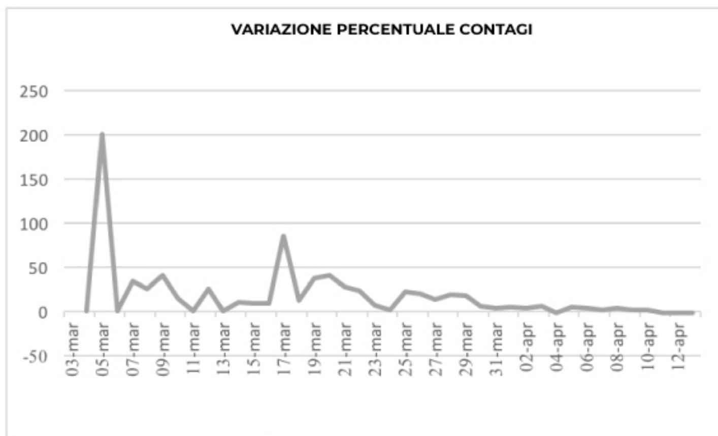
GRAFICO VARIATIONE PERCENTUALE CONTAGI