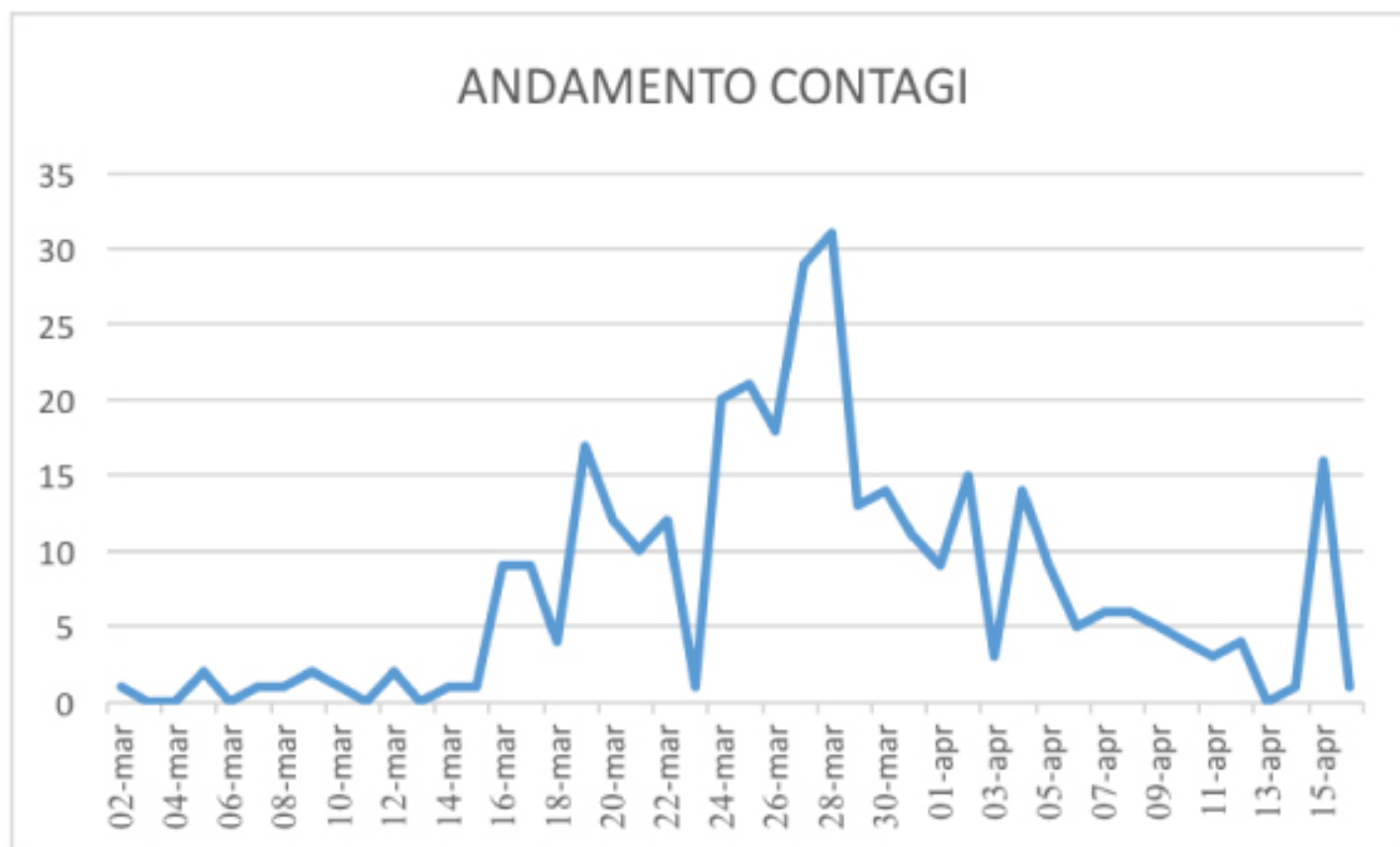
GRAFICO ANDAMENTO CONTAGI