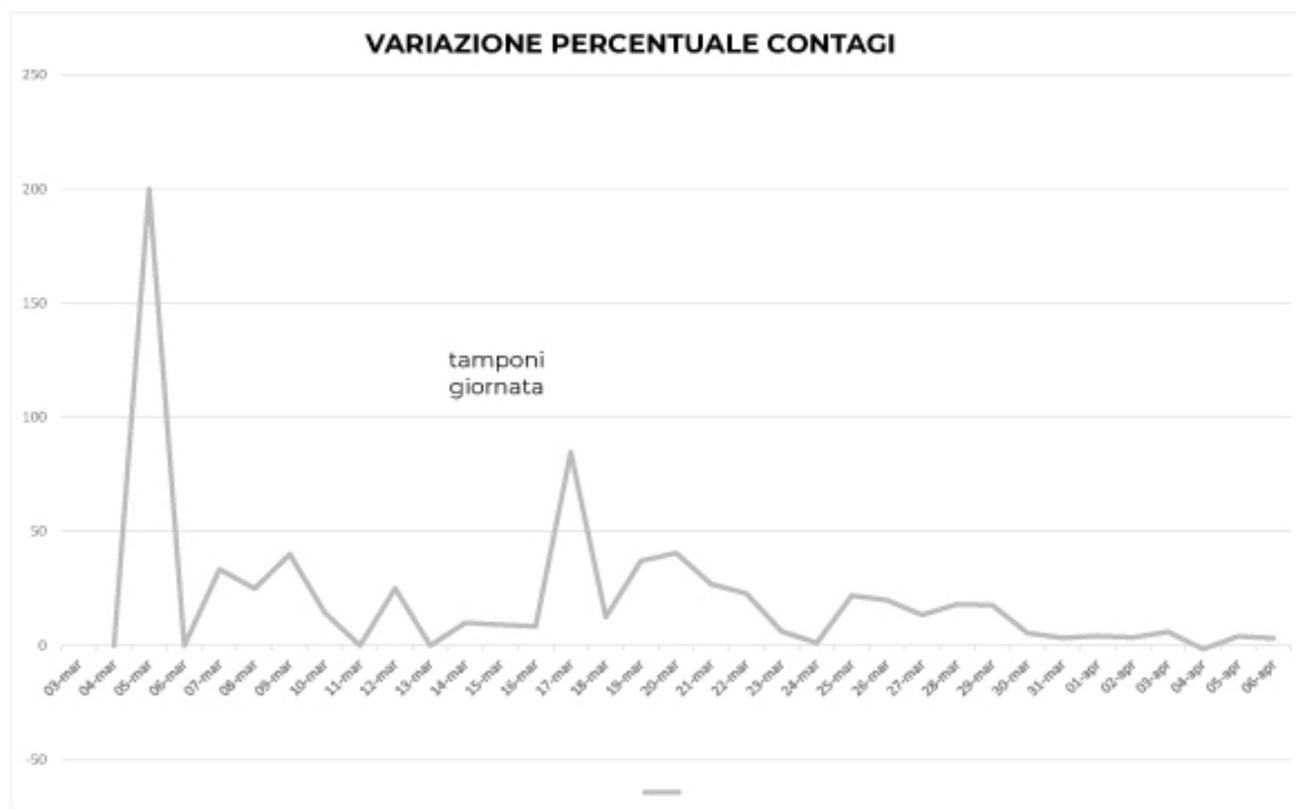
GRAFICO VARIATIONE PERCENTUALE CONTAGI