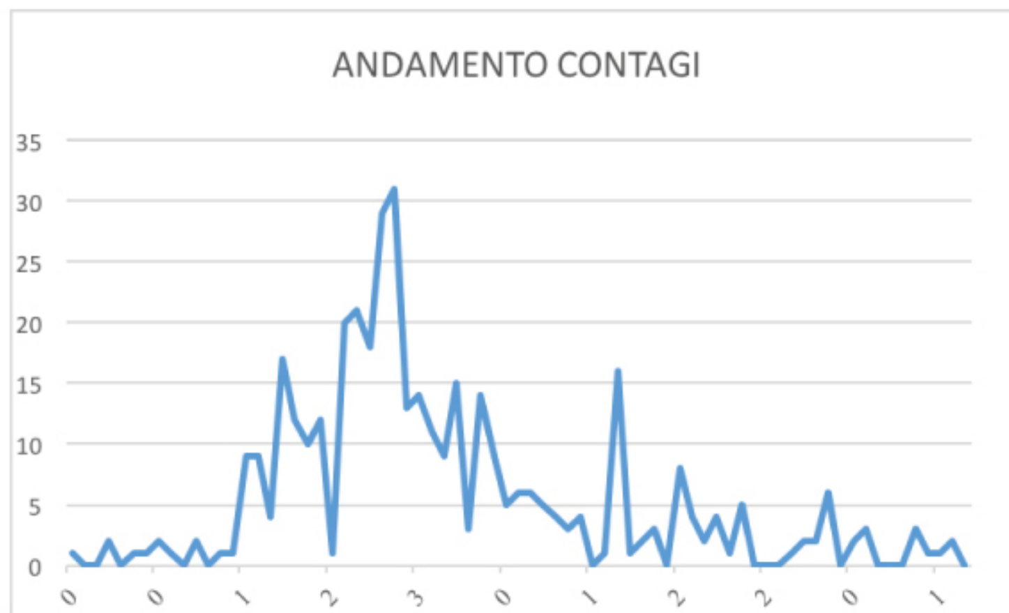
GRAFICO ANDAMENTO CONTAGI