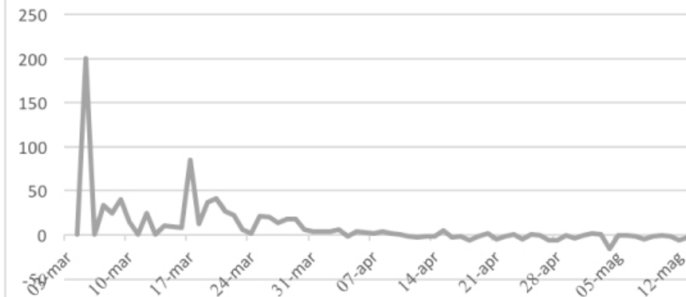
VARIAZIONE PERCENTUALE CONTAGI