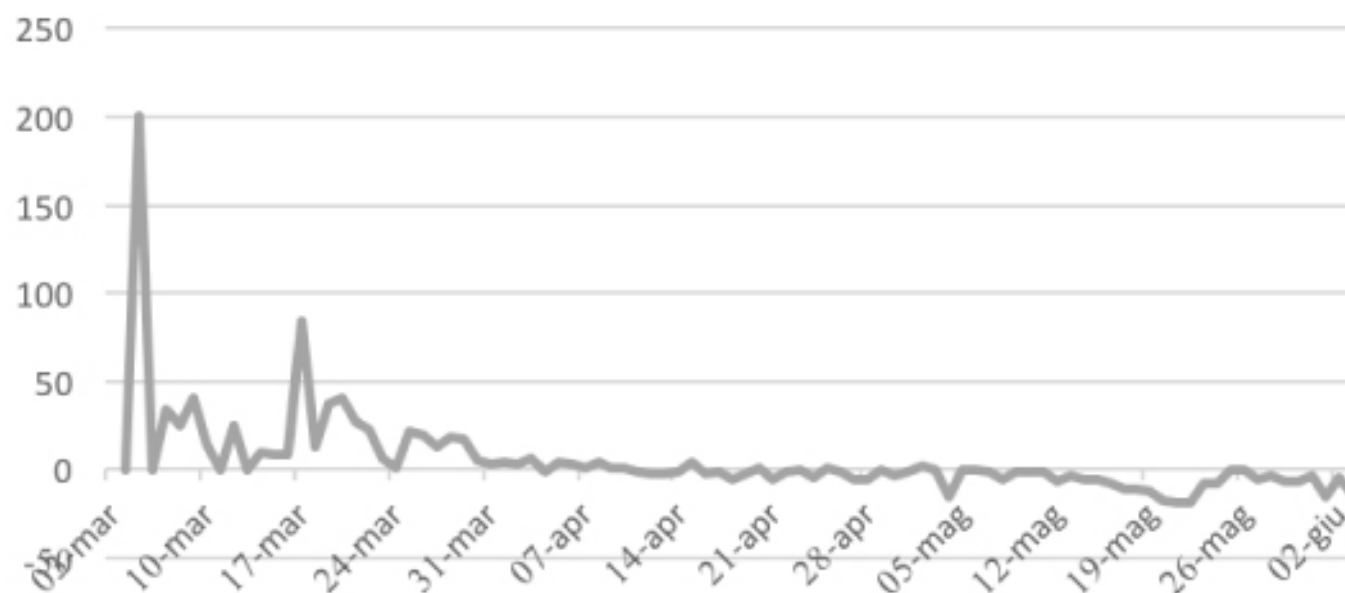
VARIAZIONE PERCENTUALE CONTAGI