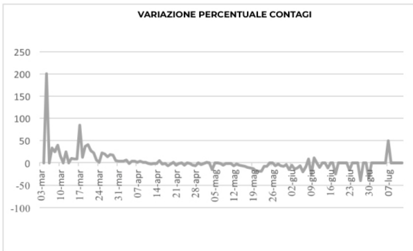
VARIAZIONE PERCENTUALE CONTAGI