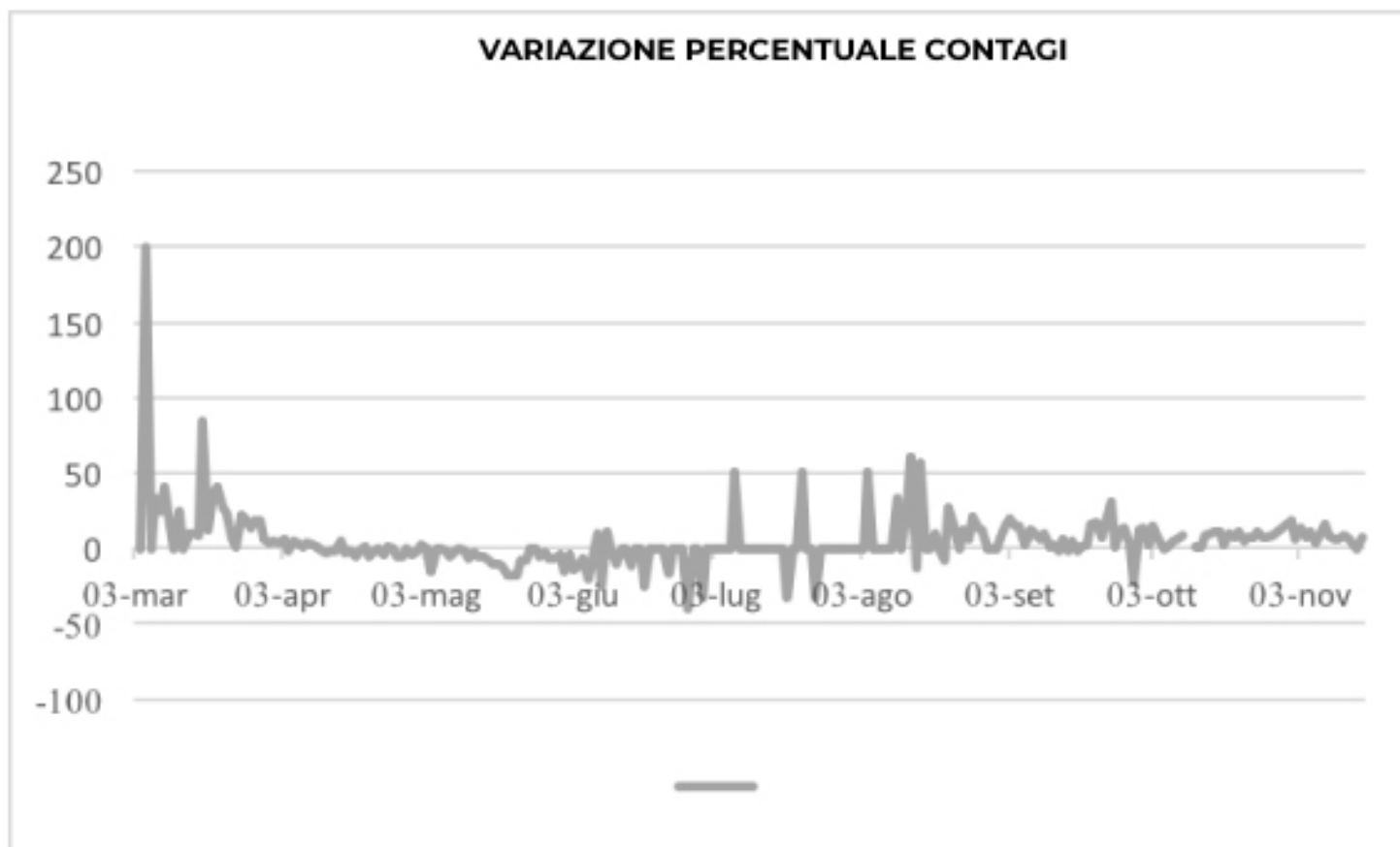
VARIAZIONE PERCENTUALE CONTAGI