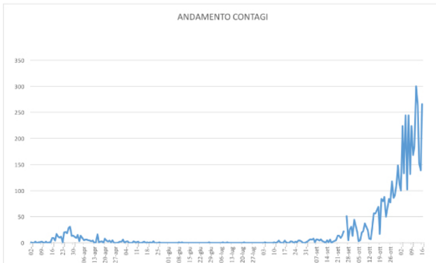
GRAFICO ANDAMENTO CONTAGI