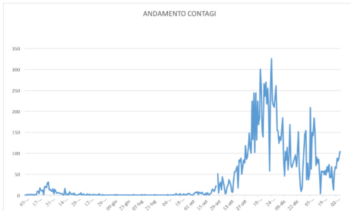
GRAFICO ANDAMENTO CONTAGI