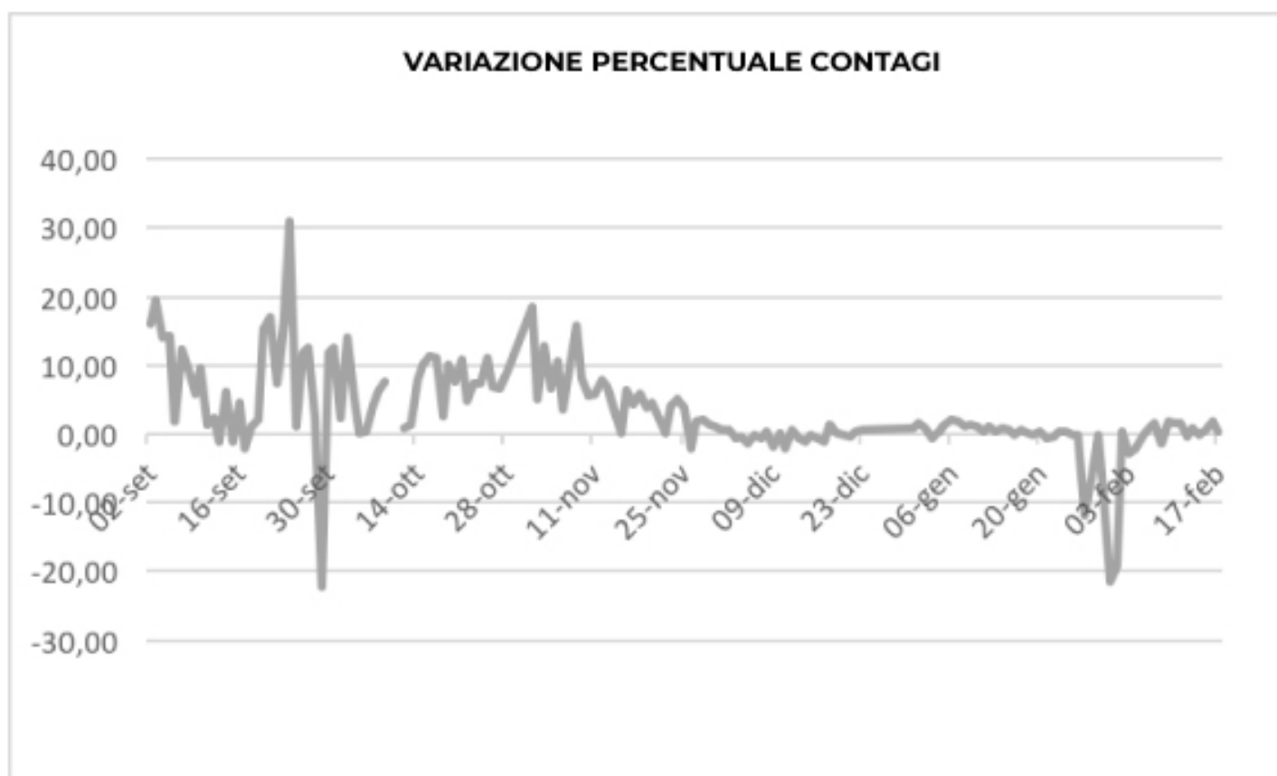
VARIATIONE PERCENTUALE CONTAGI