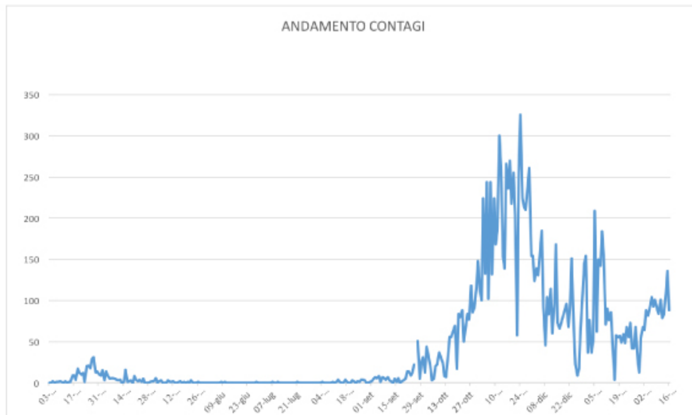
GRAFICO ANDAMENTO CONTAGI