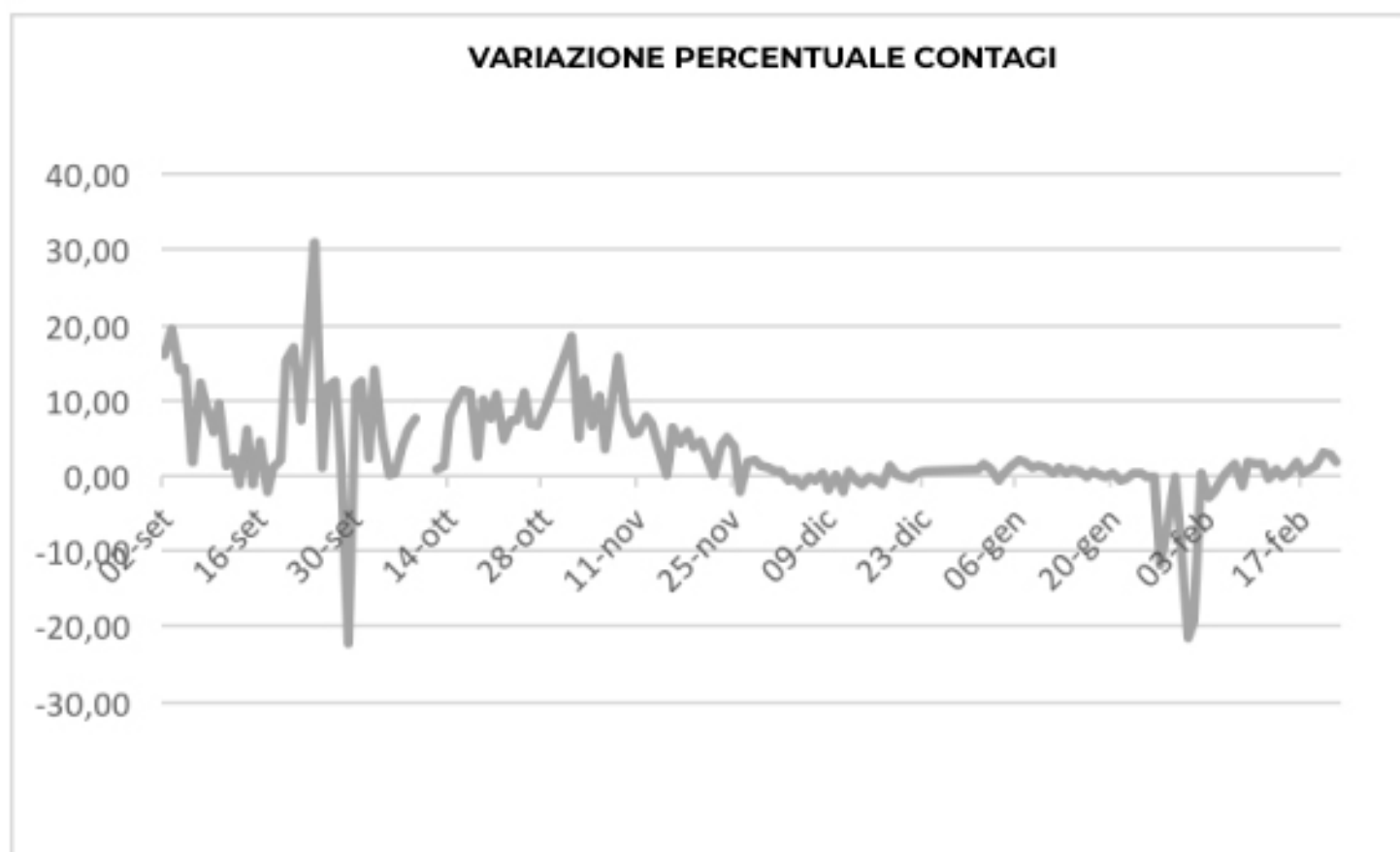
VARIAZIONE PERCENTUALE CONTAGI