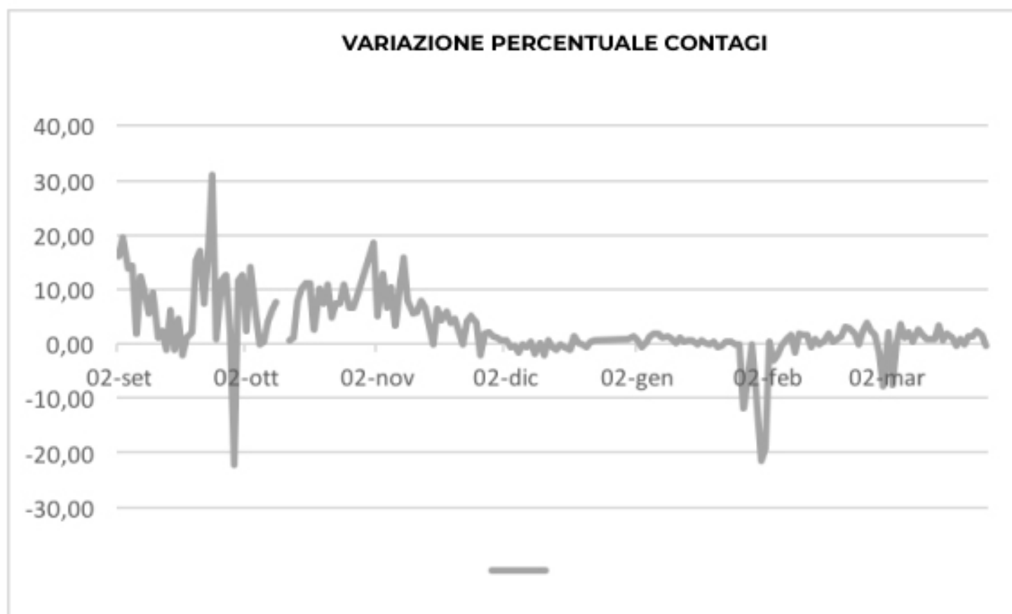
VARIAZIONE PERCENTUALE CONTAGI