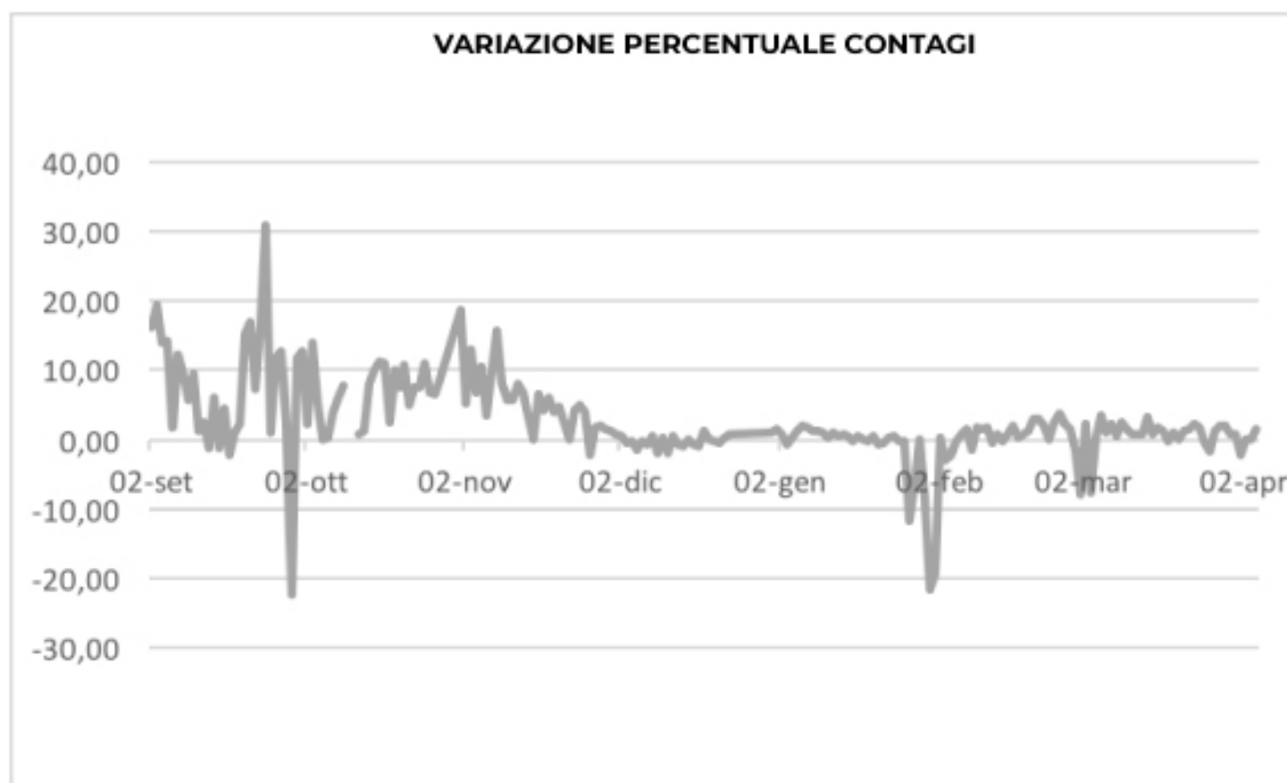
VARIAZIONE PERCENTUALE CONTAGI